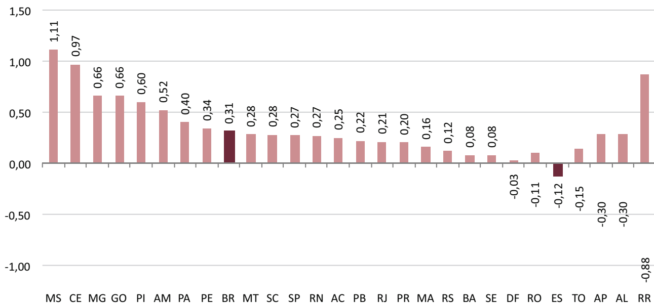
Gráfico 1 - Estoque de Empregos Formais por Unidade da Federação - Brasil Taxa de Variação (%) - Junho de 2013/Maio de 2013