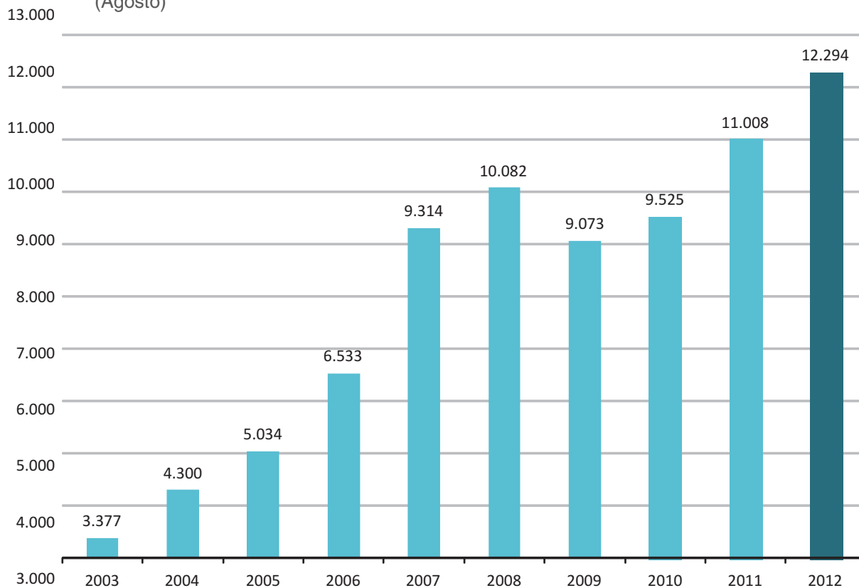
Gráfico 1 - Venda de Veículos Novos no Espírito Santo (Agosto)

Fonte: FENABRAVE. Elaboração: Coordenação de Estudos Econômicos (CEE) – IJSN.